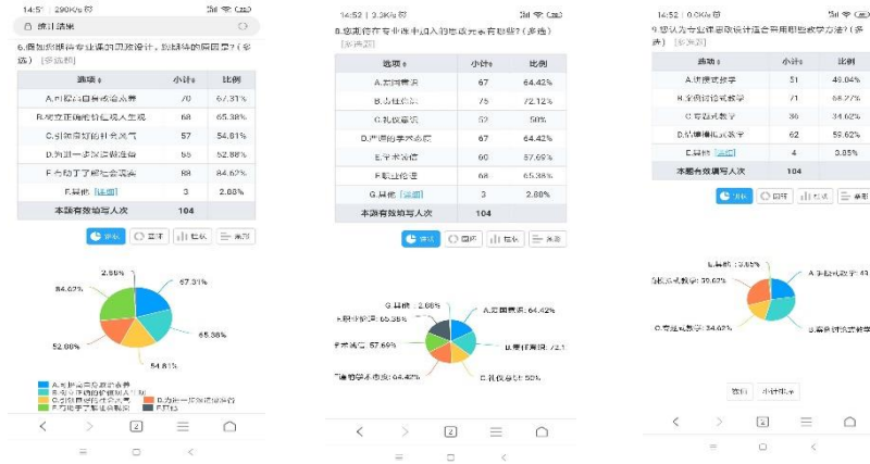
图一 期初课程思政问卷调查结果（部分）