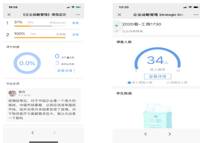
图五 课上与课后数据截图

评体系重视平台数据考核及个性化评价，线上教学参与及团队表现。借助技术平台的学情分析，通过在线考勤、考试，发布讨论信息与资源等方式，提升学生的线上课程参与度、学习积极性，全面了解学生的学习状态、知识掌握及深度理解情况。从出勤状况、课堂表现、课后资源完成情况、课程成绩四个方面构建评价指标体系（参看图五）。