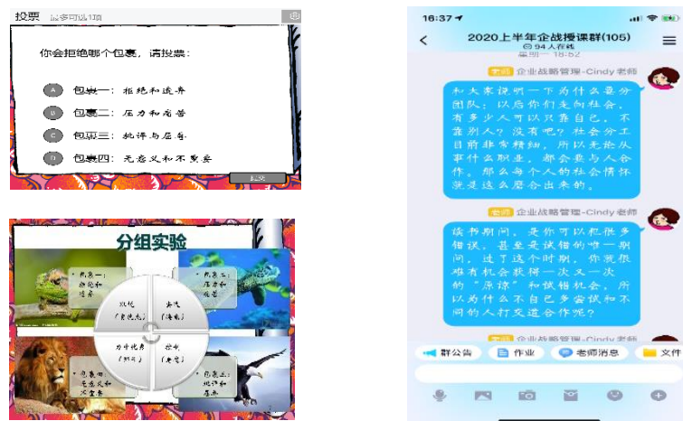
图四 课件截图与 QQ 群讨论

在分组的细节设计中，引入个体心理学的理论，利用技术平台的投票等功能，引发学生的好奇心，并初步了解学生心理情况，增加课程的趣味性（参看图四中的课件截图）；在分组的过程中，运用聊天软件对学生进行情感关怀和思想引导（参看图示四中 Q 群对学生分组的建议直言），让他们认真思考并面对自己和他人的关系，有利于课程后续的推进。