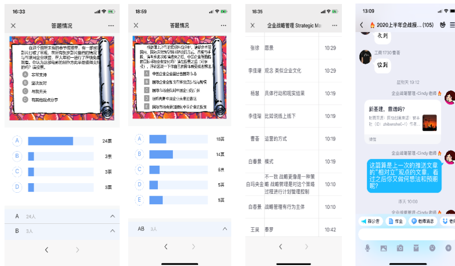
图二 线上教学内容信息截图

依托开学初的问卷结果，对《企业战略管理》课程的内容重点从前沿理论、时事政治、战略案例等方面进行了更新。同时参照 BOPPPS 教学设计的模式，对每部分教学内容进行梳理，以实现教学目标明确、理论与实践无缝衔接，在线技术与教学内容有机匹配等预期效果。具体实践中，围绕每次课程内容的预期目标，结合当前热点问题设置前测选项，了解学生的初步观点；课程中，启发学生用具体理论分析企业实践行为，通过弹幕、投票等平台手段，反馈分析和思考结果；再结合自媒体信息的解读，引导学生客观去看待中国企业所面临的情境，以及政府策略所蕴含的深意等（请参看图二）。