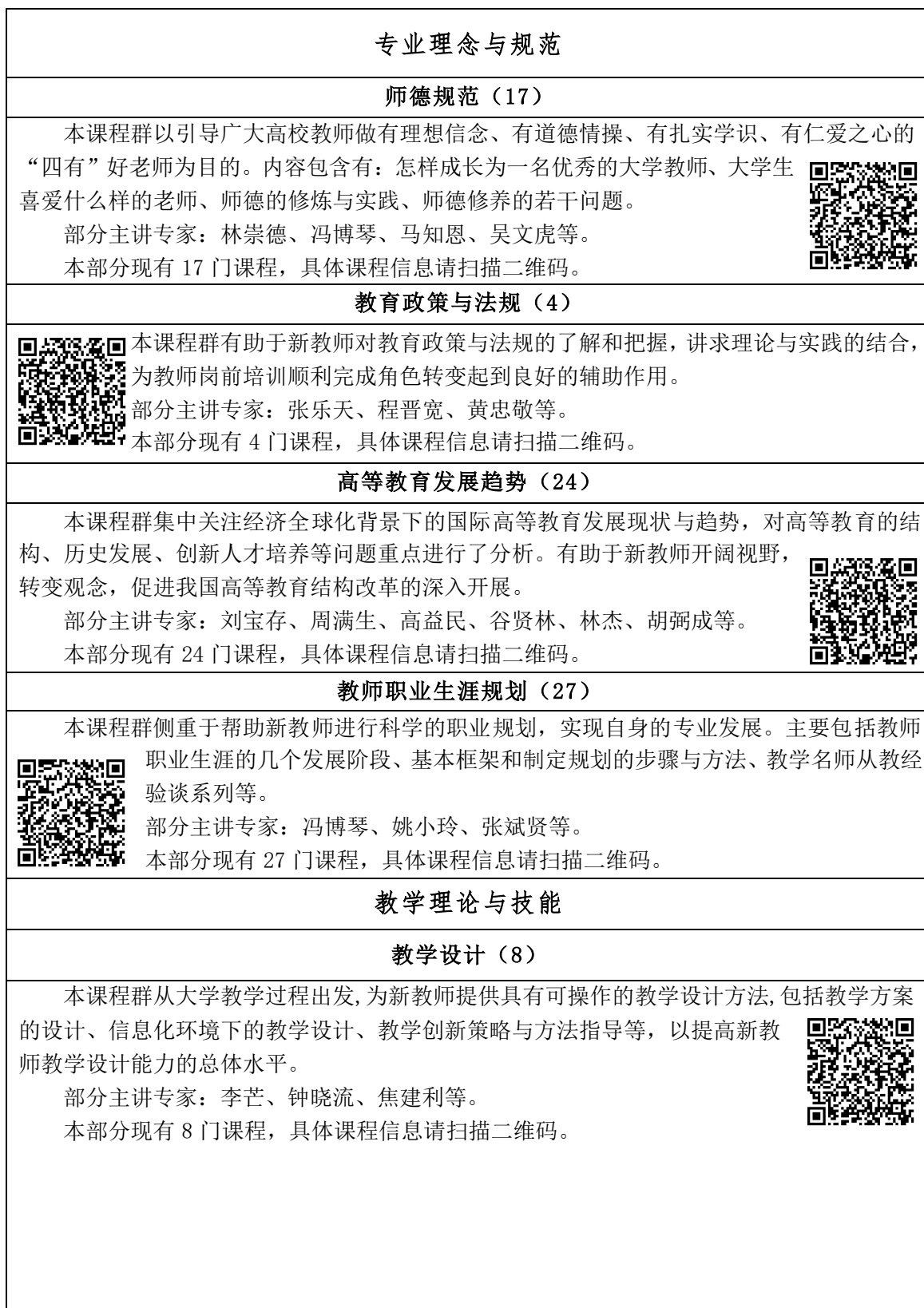
表 1 新教师在线点播培训课程